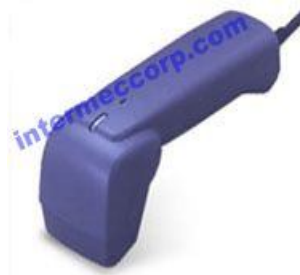
DENSO QS20H 条码扫描器

QS20H二维条码阅读器更具通用性的全方位进行识读操作的识读功能，合点，将视野范围增至3倍的LED指示器，使其集高性能，多功能，精巧设计等应用领域的好帮手。