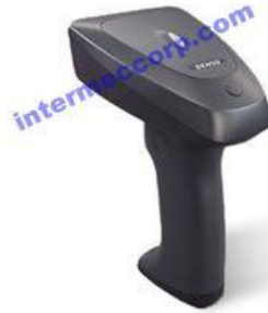
DENS0 GT10B 条码扫描器