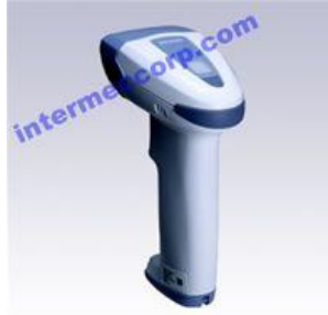
DENSO AT10Q 工商型二维条码扫描器